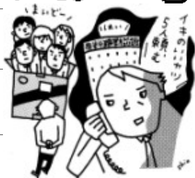
イラストは『学習の友』より

1985年、派遣法が制定されたとき、私は労働法の将来に大きな不安を感じた。予感が的中し、約20年を経た現在、非正規雇用が急増するとともに、多くの職場が労働基準法さえ守られない「労働法のない世界」に変わってしまった。九六年からは「派遣労働者の悩み110番」というホームページを開設し、メール相談を開始した。多くの相談事例は、派遣労働者の驚くべき無権利な現実を示すものであった。